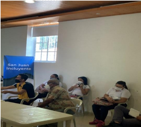
Fotografía 3. Jornada de Socialización de la Política Publica formulación Política PcD. Casa Pastoral