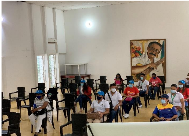
Fotografía 2. Proceso participativo con los actores e identifican de líneas de acción estratégica